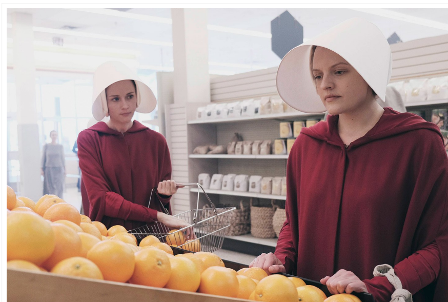
Una escena de "The Handmaid's Tale", guanyadora de l'Emmy a millor sèrie dramàtica del 2017

L'onze de setembre vaig ballar Jarabe de Palo al costat d'una noia amb una bandera feminista al costat. L'observava de reüll, sense pretendre causar-li incomoditat. Però per dins, jo somreia. El dilluns passat vaig preparar-me una copa de vi després d'arribar de la feina, i vaig encendre la televisió, cansada de tanta tertúlia amb barates aspiracions postmodernes. I vaig gaudir de la 69a gala dels Emmy, de la qual van sortir guanyadores sèries com The Handmaid's Tale i Big Little Lies . Aquest cop no em feia falta mirar de reüll, però per dins, seguia somrient.